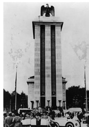
Le Pavillon Allemand Exposition Universelle de Paris, 1937