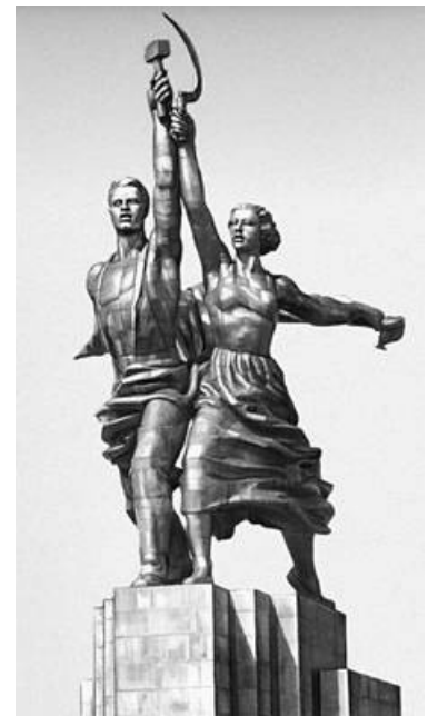
L'ouvrier et la kolkhozienne du Pavillon Soviétique Exposition Universelle de 1937 à Paris

Activités en Histoire, Lettres et Arts plastiques sur les dictateurs du XXème siècle