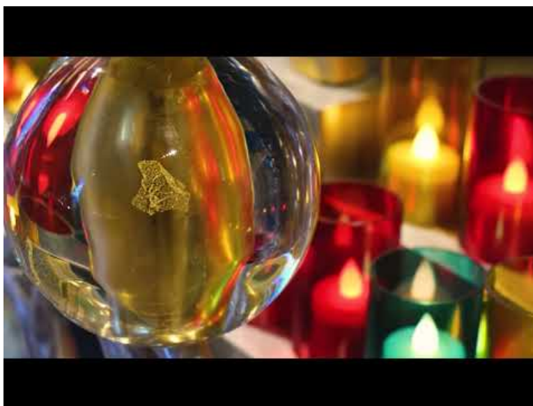
Trésor de la cathédrale d'Angoulême : introduction (Video Youtube)

Une mention pour le Trésor de la cathédrale d'Angoulême mis en scène par l'artiste plasticien Jean-Michel Othoniel .