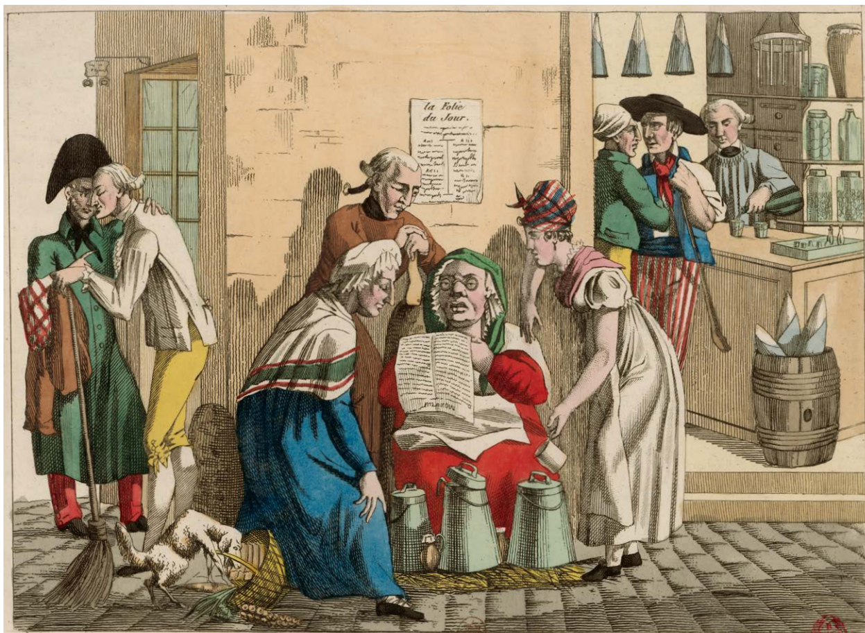
Mme Caquet, laitière [sic], ou la nouvelliste du quartier 1797-1810

Désinformation, post-vérité, conspirationnisme, rumeur, mensonge, canular, propagande... la fausse nouvelle est protéiforme. La Bibliothèque nationale de France et le CLEMI (Centre pour l'éducation aux médias et à l'information) proposent de traiter cette question essentielle pour notre démocratie par l'étude des documents patrimoniaux. Cette exposition en affiches propose des outils et des pistes de réflexion permettant de se repérer, de trier, d'identifier les sources et l'information pertinente pour cultiver l'exercice citoyen d'un doute méthodique.