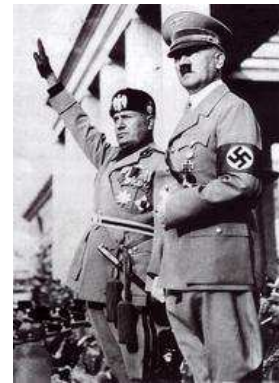
1. Gerardo Dottori. « Les villes de la révolution » 2. Affiche de Mario Sironi 3. Mussolini et Hitler