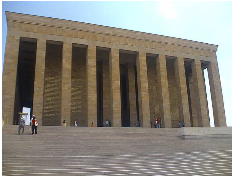
Mausolée d'Atatürk. Ankara. (Turquie)

En Turquie , un autre pays blessé par la Grande Guerre, le « fascisme » fait aussi un émule. Le général Moustafa Kemal instaure sa dictature avec la volonté de construire une nation à base raciale sur les ruines de l'empire multiculturel ottoman. Il invente à la Turquie une Histoire qu'il fait remonter aux Hittites. Il introduit l'alphabet latin en remplacement de l'arabe, instaure la laïcité et le 3 mars 1924, abolit le califat, pour couper les ponts avec la culture arabo-musulmane qu'il juge déliquescence.