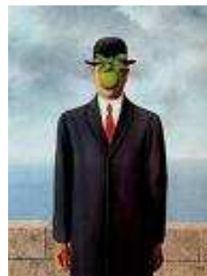
“Le fils de l'homme”, René Magritte