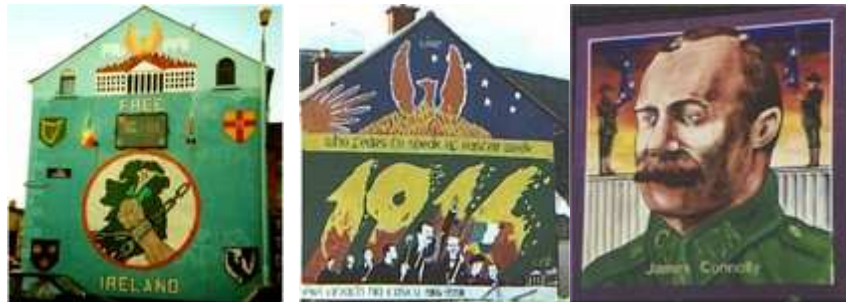
Quelques murs de Belfast