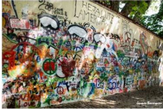
Le mur de John Lennon à Prague situé en face de l'ambassade de France

Lennon était un héros pour les jeunes pacifistes d'Europe centrale et Europe de l'Est à l'époque totalitaire. Avant 1989, quand le communisme a statué, des chansons pop occidentale ont été interdites par les autorités communistes, et surtout des chansons de John Lennon, car il faisait l'éloge de la liberté qui n'existait pas à l'Est. Certains musiciens ont effectivement été emprisonnés pour les avoir joués!