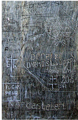
Graffiti : mots d'amoureux et de passants gravés sur un mur

Les graffitis existent depuis des époques reculées, dont certains exemples remontent à la Grèce antique ou à l'Empire romain. Ils peuvent aller de simple marques de griffures à des peintures de murs élaborées.