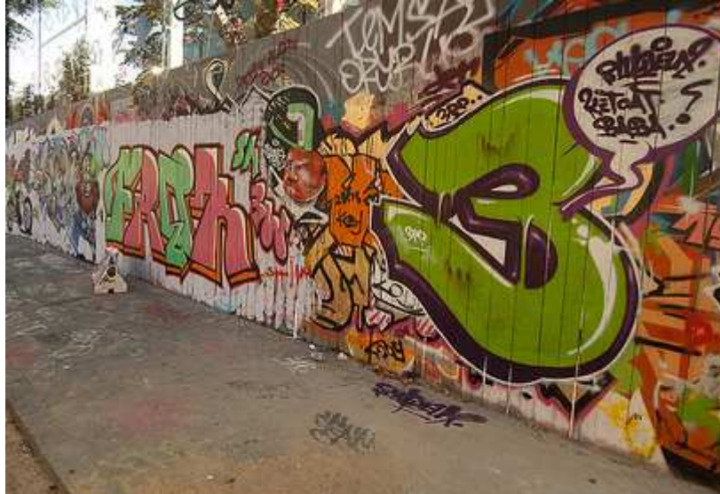
Graffitis réalisés par un étudiant en Art graphique sur la barrière d'un musée, Paris août 2009