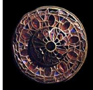
Fibule lombarde. Musée de Turin