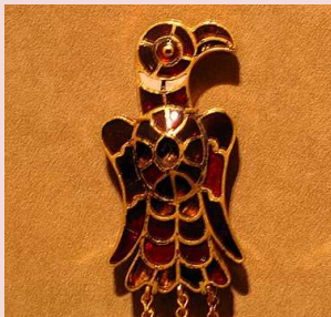
Fibule wisigothique. VI è.s. Espagne.

Mobiliser les connaissances sur les Coptes. Souvenons-nous des sarcophages. Parler de l'actualité, la persécution des Coptes : les Chrétiens d'Égypte.