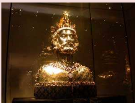
Buste reliquaire de Charlemagne

Contrairement aux idées longtemps reçues, l'art des « envahisseurs » n'a rien de « barbare »