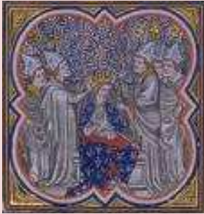
Couronnement de Charlemagne par le Pape en 800 à Rome.