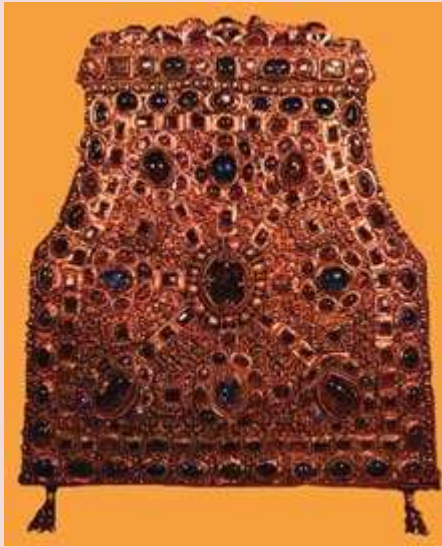
Reliquaire lombard contenant une dent de Saint Jean Baptiste. IX ème s. Trésor du Dôme de Monza. (Italie).