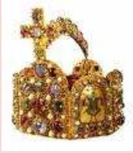
Couronne de Charlemagne