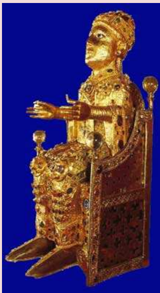
Reliquaire de Sainte Foy de Conques, vers 975.

l'Empire. C'est le renouveau intellectuel de l'empire romain depuis sa chute Dans l'art, l'écriture et la vie spirituelle, on retourne aux modèles antiques.