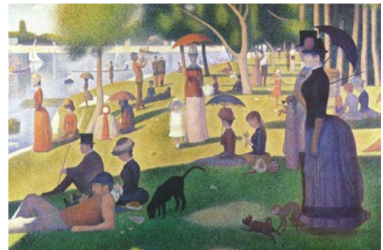
Collection Art Institute, Chicago

Georges Seurat, Un dimanche après-midi à l'île de la Grande Jatte .