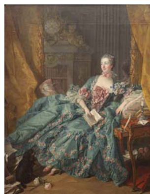
Collection Alte Pinakothek, Munich

François Boucher, Portrait de Madame de Pompadour.