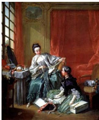
Collection Nationalmuseum, Stockholm