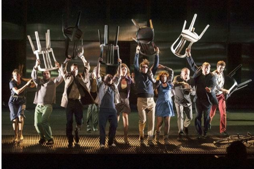
Mise en scène d'Emmanuel Demarcy-Mota, Théâtre de la Ville, 2014

➤ Regardez un extrait vidéo de la pièce Rhinocéros et d'après le jeu des acteurs, retrouvez le passage correspondant dans le texte d'Eugène Ionesco