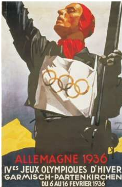
Affiche officielle des jeux d'hiver