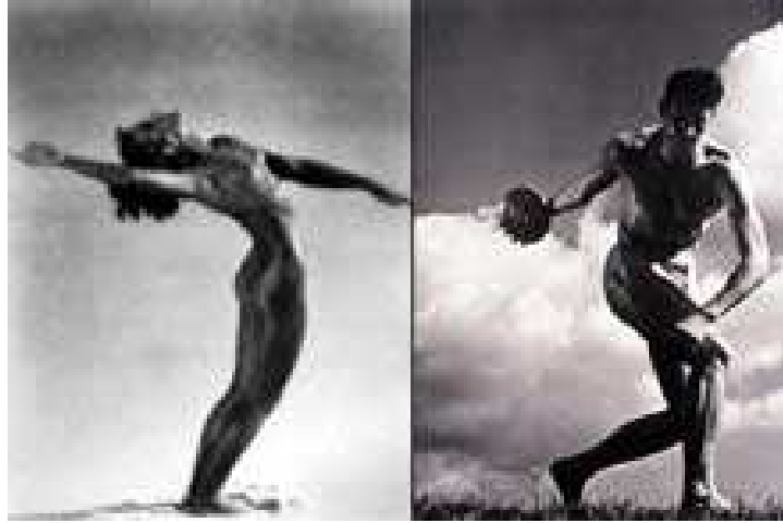
Photos extraites du film de Leni Riefenstahl