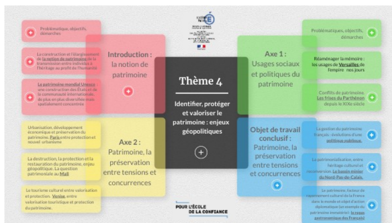
Thème 4 - Identifier, protéger et valoriser le patrimoine : enjeux géopolitiques (Genially)

Thème 4 - Identifier, protéger et valoriser le patrimoine : enjeux géopolitiques