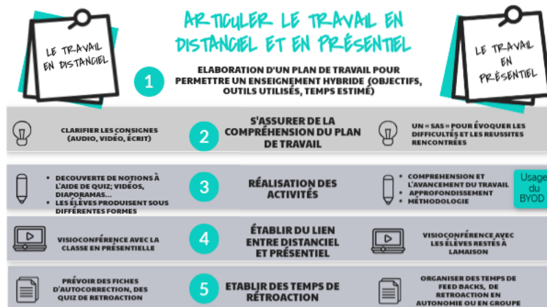
distanciel présentiel by laetitia2.leraut on Genially (Genially)

Discover more about distanciel présentiel - Presentation