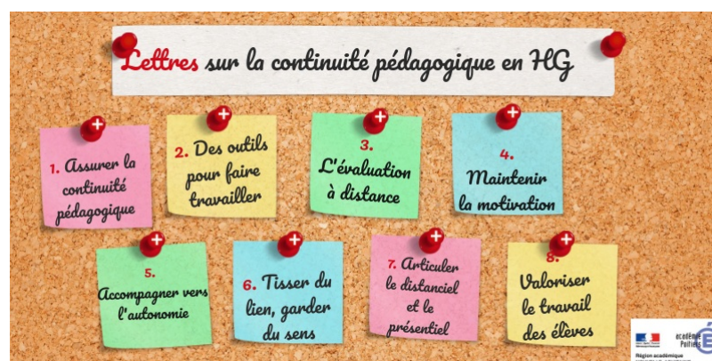
Lettres HG 1 à 8 by laetitia2.leraut on Genially (Genially)

Ci-dessous un récapitulatif des différentes thématiques abordées dans les lettres hebdomadaires pour la continuité pédagogique en Histoire-Géographie.