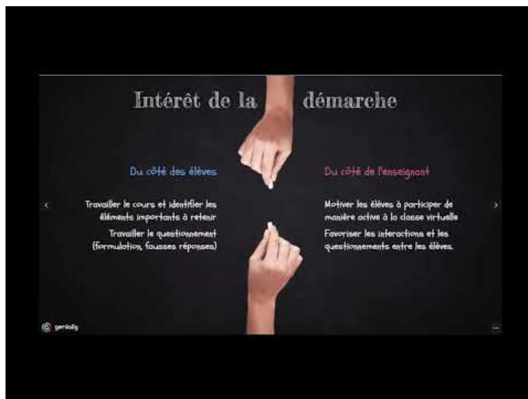
Co Animer une classe virtuelle avec Kahoot! (Video Youtube)