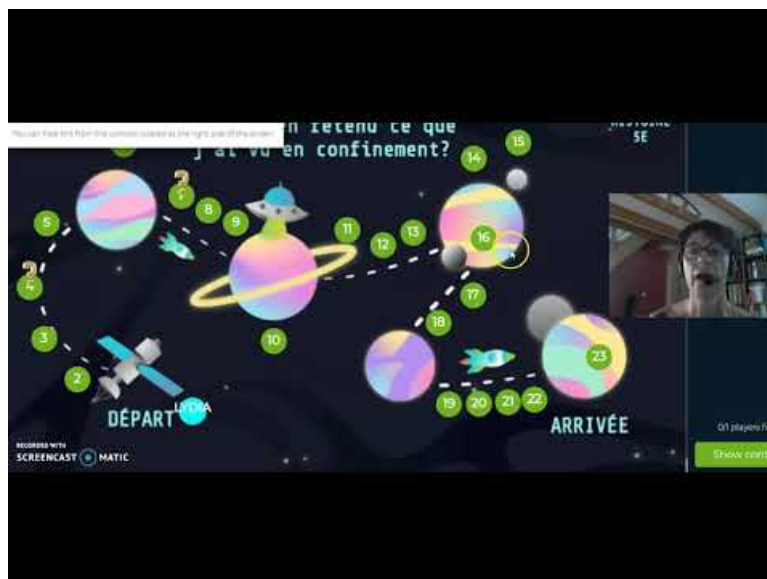
EXPLICATIONSQUIZWHIZZER5 (Video Youtube)