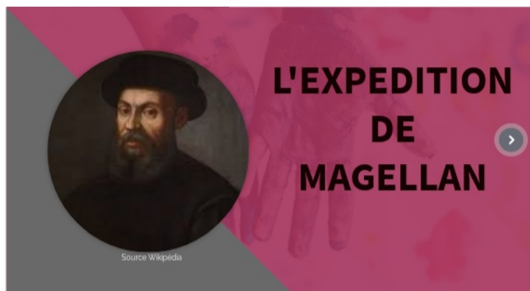
magellan by College Maurice Genevoix on Genially ( Genially ) Discover more about magellan - Presentation

Un exemple en 5ème sur Magellan et son équipage :