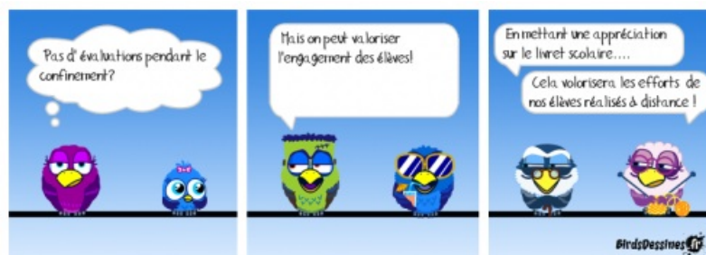
Valorisation des élèves-enseignement à distance

Vous vous demandez sans doute comment maintenir l'implication alors que les évaluations de la période de confinement seront neutralisées et que l'engagement des élèves dans le travail pourra faire l'objet d'une valorisation sous la forme d'une appréciation sur le livret scolaire. Cette lettre vous propose des pistes de réponse, sans pour autant viser à faire de l'accompagnement de l'implication un instrument de contrôle à distance des élèves.