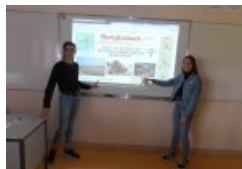
MOOCHG6 - Elèves à l'oral