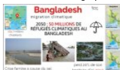
MOOCHG6 - Infographie 2