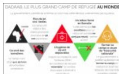
MOOCHG6 - Infographie 1

MOOC HG6 - Activité 1 : L'infographie au service de l'oral (CANVA) - Académie de Poitiers.