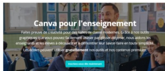
MOOCHG6 - Logo CANVA

Tutoriel CANVA 1 : version light de prise en main