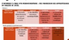
Échelles descriptives du cycle 4 au lycée : S'informer dans le monde du numérique TraAM histoire géographie, académie de Poitiers, 2017-2018.