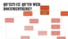
S'informer dans le monde du numérique avec les webdocumentaires TraAM histoire géographie, académie de Poitiers, 2017-2018.