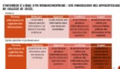
Échelles descriptives du cycle 4 au lycée : S'informer dans le monde du numérique TraAM histoire géographie, académie de Poitiers, 2017-2018