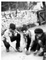
Exposition itinérante "Traqués, cachés, sauvés. Être juif en Poitou (1940-1944)"

L'exposition Traqués, cachés, sauvés. Être juif en Poitou (1940-1944) , met quant à elle en lumière les formes de solidarité et d'entraide développées par la population - à titre individuel ou collectivement par les organisations de Résistance - pour venir en aide aux juifs persécutés en France.