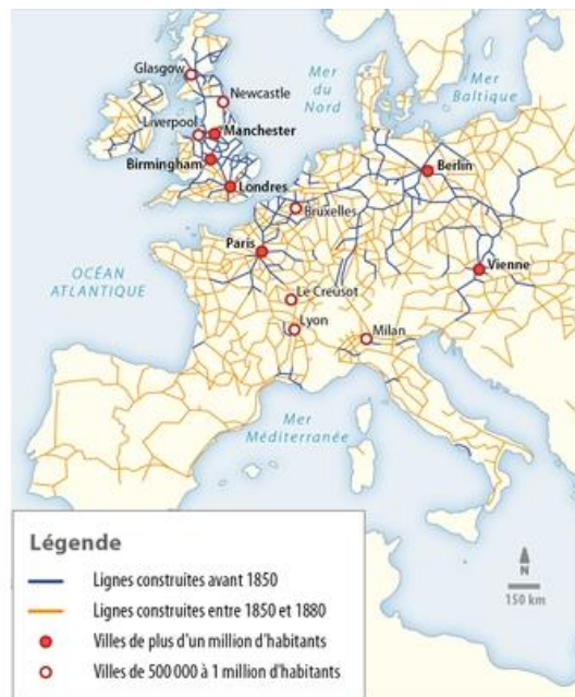
L'évolution du réseau de chemin de fer en Europe au XIXe siècle.