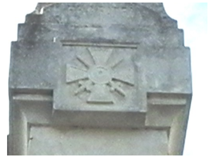
La croix de guerre