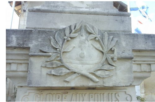
Une médaille de guerre entourée d'une couronne de lauriers