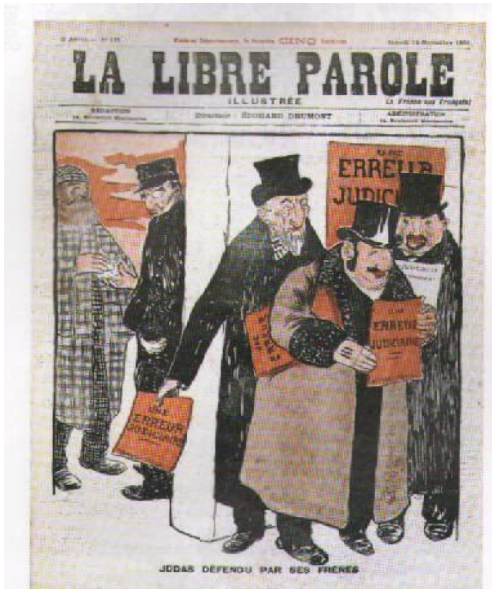
La Libre Parole (directeur : Edouard Droumont). "Judas défendu par ses frères", 14 novembre 1898