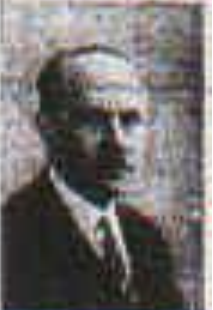
Léon Blum, au nom du Groupe socialiste

LÉON BLUM, LE GÉNÉRAL DE GAULLE, LE GÉNÉRAL DE MONTMAYOUR, LE GÉNÉRAL DE MONTMAYOUR, LE GÉNÉRAL DE MONTMAYOUR, LE GÉNÉRAL DE MONTMAYOUR, LE GÉNÉRAL DE MONTMAYOUR