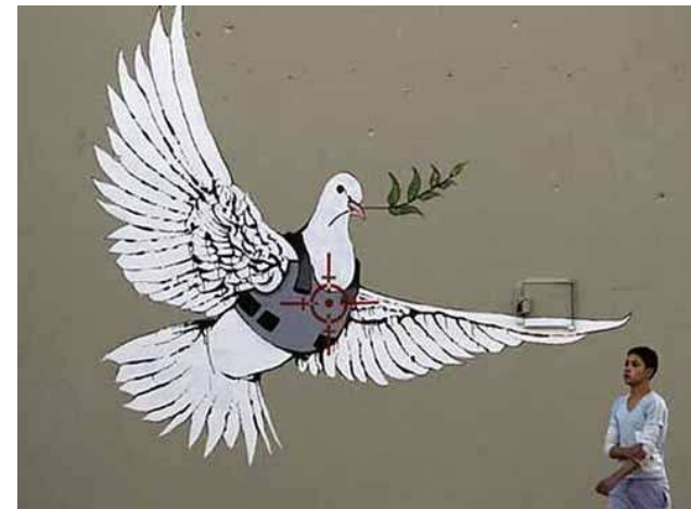
Banksy ,graffiti, mur de séparation israélien en Cisjordanie, 2005