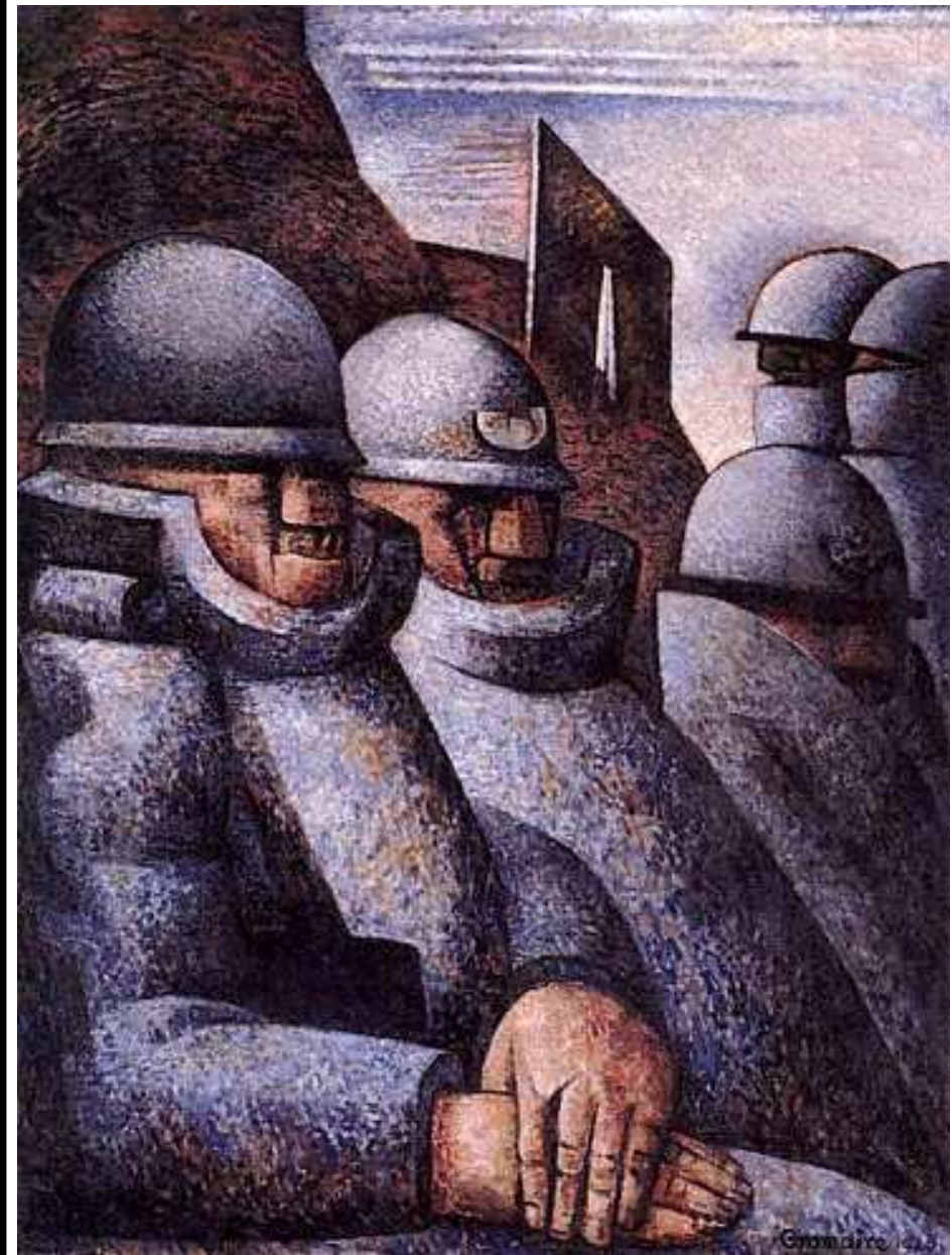
Marcel Gromaire, La Guerre , 1925, huile sur toile, 127,6 x 97,8 cm, Musée d'art moderne de la Ville de Paris.