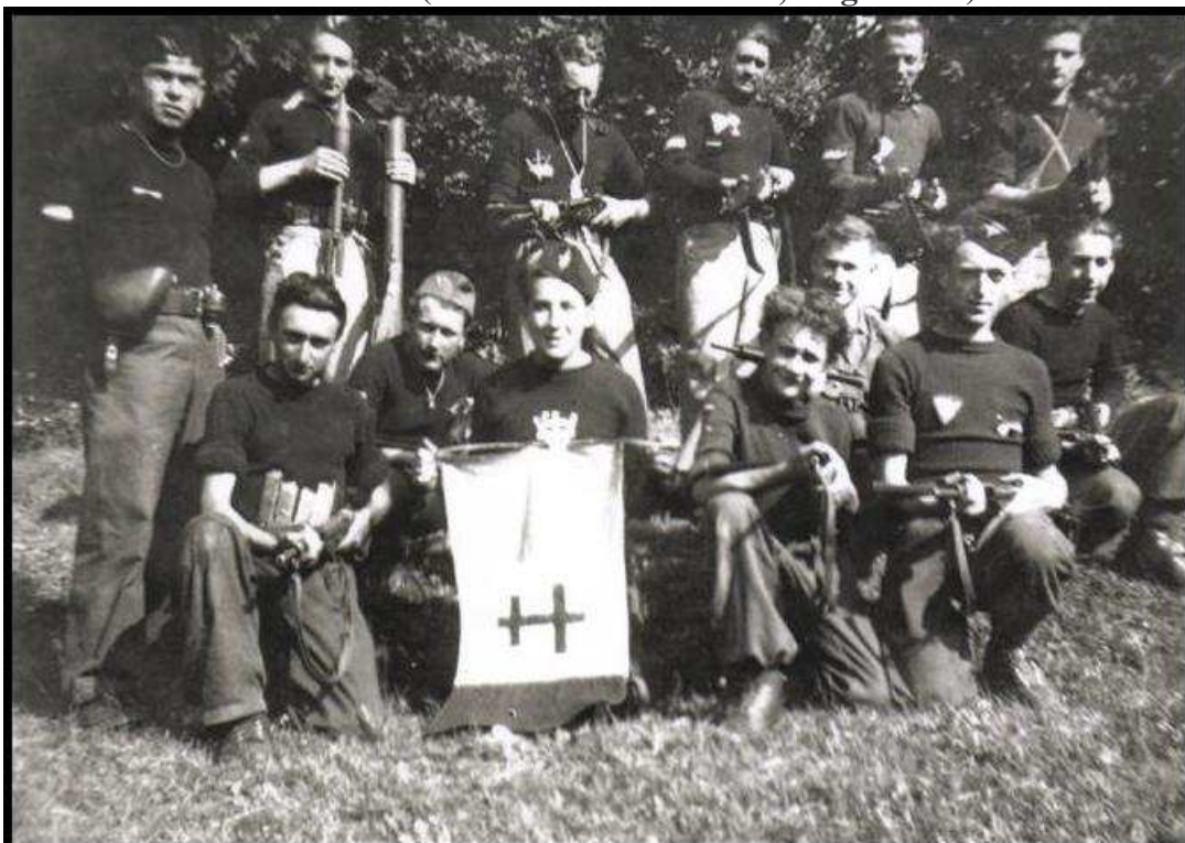
Jeunes du maquis Bir' Hacheim (Charente, 1944)