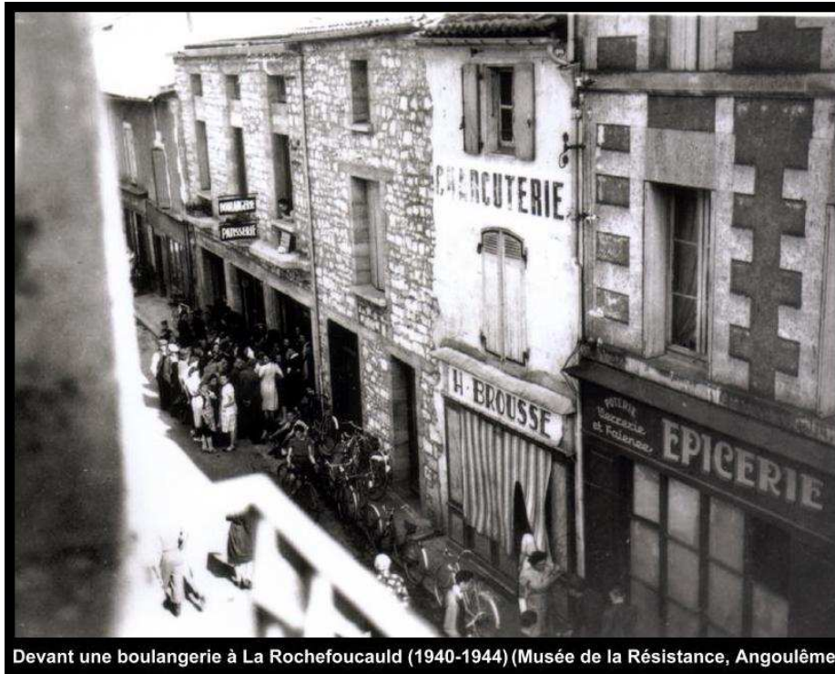
Devant une boulangerie à La Rochefoucauld (1940-1944)