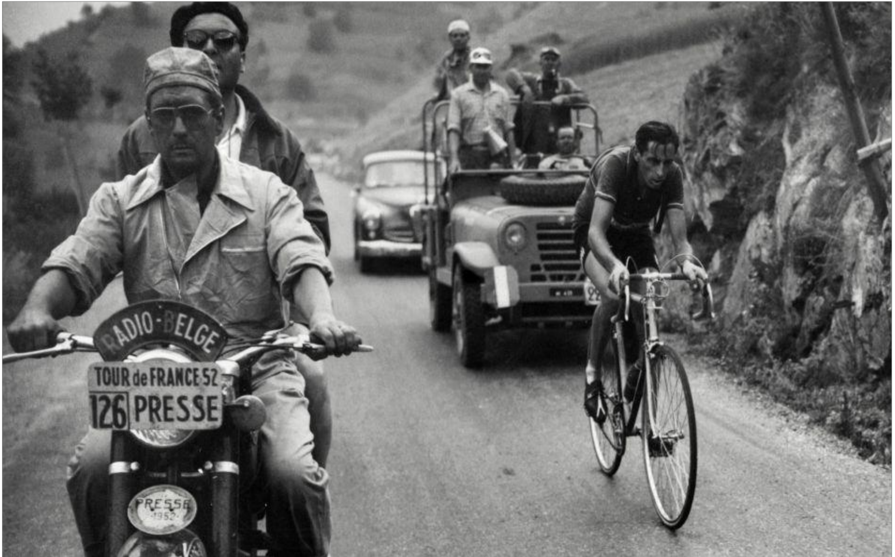
Photo de Fausto Coppi (tour 1952) pouvant permettre aux élèves de rentrer dans le thème.