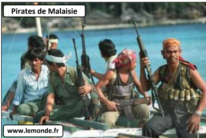
Pirates de Malaisie

D'après un article paru sur www.diploweb.com , 15 juin 2014