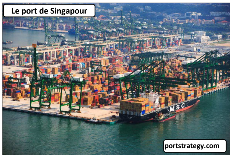
Le port de Singapour