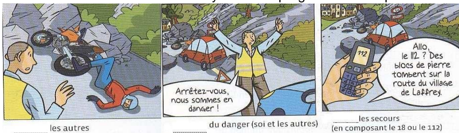
..... les autres

BD sécurité : Demain citoyen 5ème programme 2010 p 81