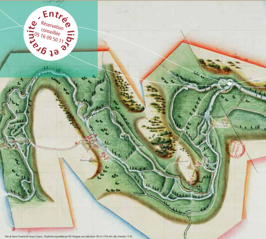
Plan du fleuve Charente de Civray à Cognac, 29 planches aquarellées par P.M. Trésaguet, sans date [entre 1761 et 1774], Arch. dép. Charente, 1 C 93.

Entrée libre et gratuite Réservation conseillée 05 16 09 50 11