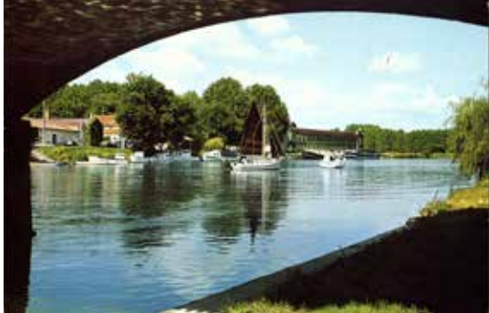
Bateaux de plaisance sur la Charente, Jarnac, s.d. Arch. dép. Charente 11 Fi 167/78

Jeudi 26 avril, 17h - durée : 50 minutes