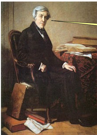
L'historien français Jules Michelet (1798- 1874)

« Les hommes prennent les Bastilles, les femmes prennent les rois ».