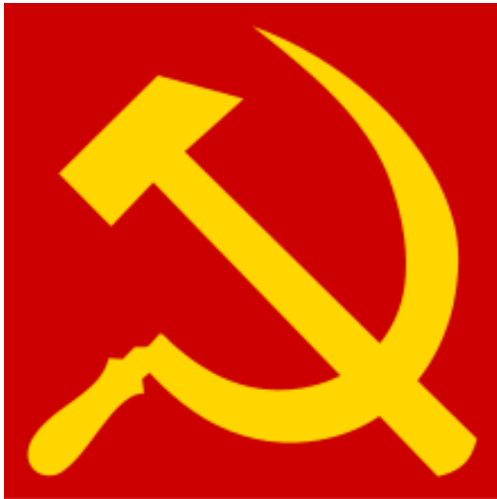
Symbole du communisme.

Le communisme est l'idéologie d'une société égalitaire sans différence de richesse et sans propriété privée.