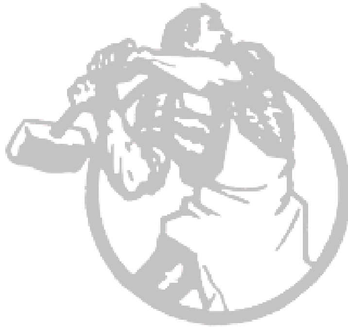
Symbole de l'International communiste.

Les bolcheviks russes et surtout Lénine sont à l'origine de la IIIème International aussi appelée l'International communiste. Le but est de fonder dans chaque pays, un parti révolutionnaire de type nouveau, le parti communiste.