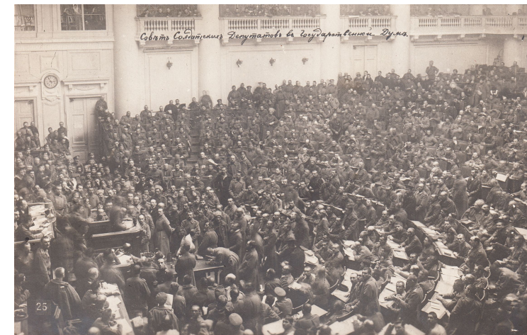
Le soviet de Petrograd en 1917.