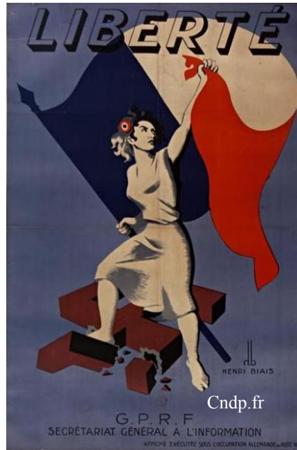
AFFICHE EXECUTEE SOUS L'OCCUPATION ALLEMANDE en AOUT 1944

http://fr.calameo.com/read/0028501066dac60d8bbc4?authid=eWREHXBR3fi4