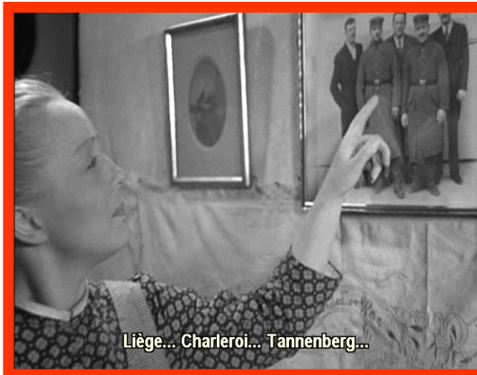
Liège... Charleroi... Tannenberg...