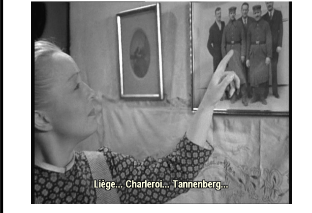
Liège... Charleroi... Tannenberg...