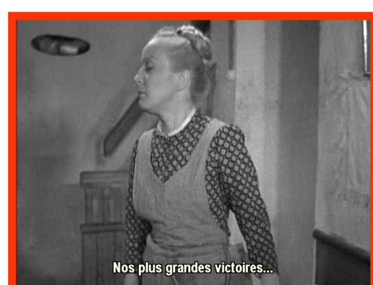
Nos plus grandes victoires...