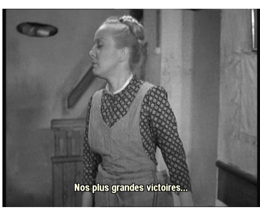
Nos plus grandes victoires...