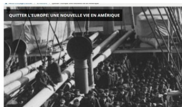
Quitter l'Europe : une nouvelle vie en Amérique

⑤ Prends le temps de lire l'introduction.