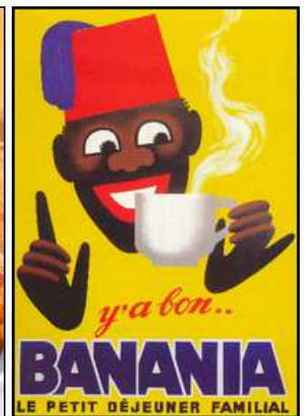
Publicité Banania en 2011

Des actes inacceptables dans le football : « Lors du match Bastia-Nice, le footballeur d'origine africaine Mario Balotelli a été pris à partie par les supporters bastiais. Des cris d'animaux sont descendus des tribunes, clairement audibles sur les vidéos du match. Le joueur s'est exprimé sur son compte Instagram : « Est-ce normal que les supporters de Bastia fassent des bruits de singes et des « ouh-ouh » pendant tout le match et que personne de la commission de discipline ne dise quoi que ce soit ? Est-ce que le racisme est légal en France ? ». Leparisien.fr, 22/01/2017