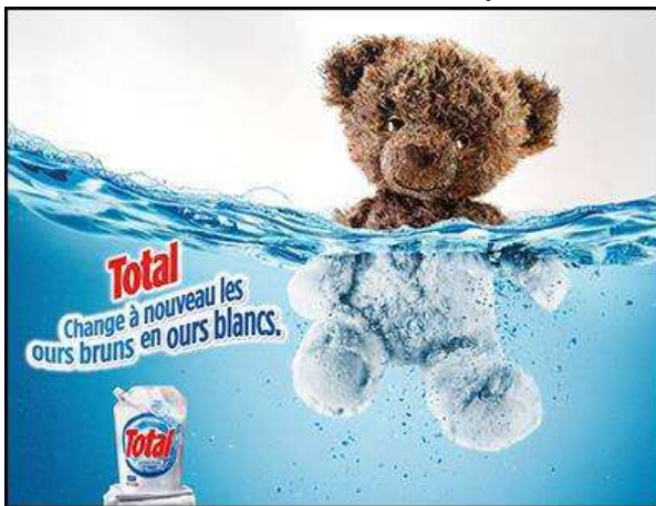
Publicité suisse pour une lessive en 2014