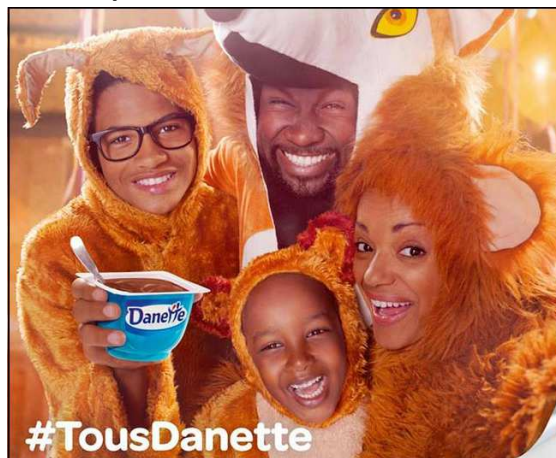
Publicité Danette en 2014