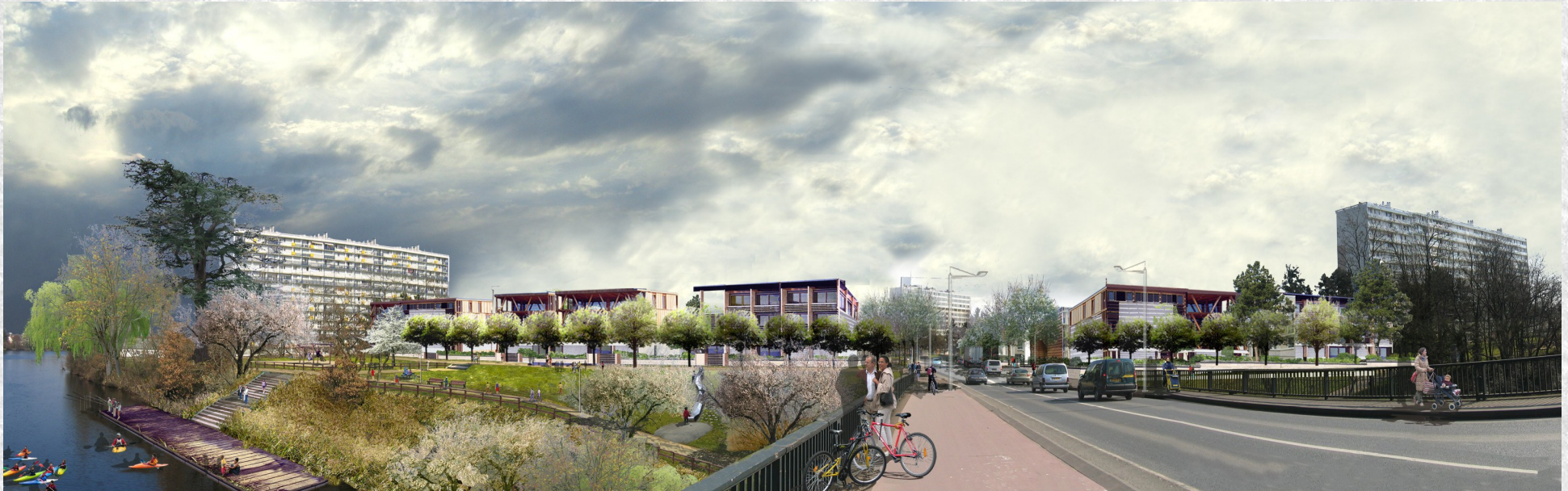
Vue des Berges de Vienne (à 10 ans)

Dans l'esprit du programme (choisir un aménagement proche du lycée), cette partie sera traitée par l'intervention, au lycée d'un responsable de la municipalité chargé de la conduite du projet, avec exposition photo ou par une visite sur le quartier même, guidée par le même responsable. Dans les deux cas, deux étapes: