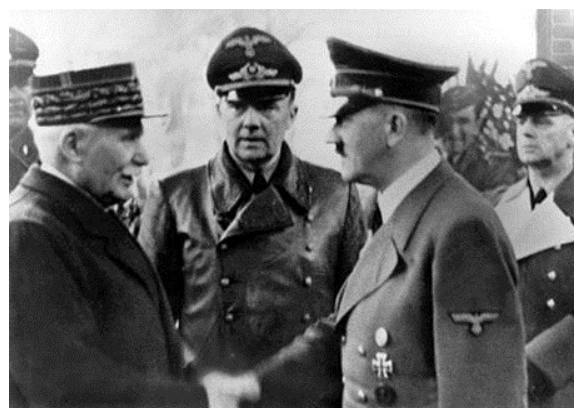
Entrevue de Montoire en 1940 entre Hitler et Pétain qui fait entrer la France dans la voie de la collaboration avec l'Allemagne