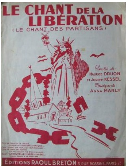
Feuillet de la chanson « Le Chant des Partisans »