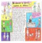
L'affiche de GC