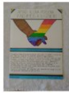
L'affiche de MF