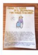
L'affiche de CB

● Secuencia : El descubrimiento de América : ¿encuentro o desencuentro ? Una polémica que no cesa.