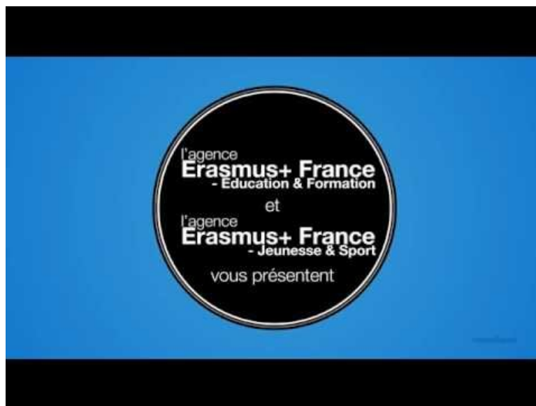
Erasmus+ : qu'est-ce que c'est ? (Video Youtube)

Il existe différents types de partenariats européens. Erasmus+ est le programme pour l'éducation, la formation, la jeunesse et le sport dont s'est dotée l'Union européenne pour la période 2014-2020. Avant de vous lancer dans un projet Erasmus+, votre établissement devra s'enregistrer afin d'obtenir un code OID qui vous servira pour déposer votre demande 1 .