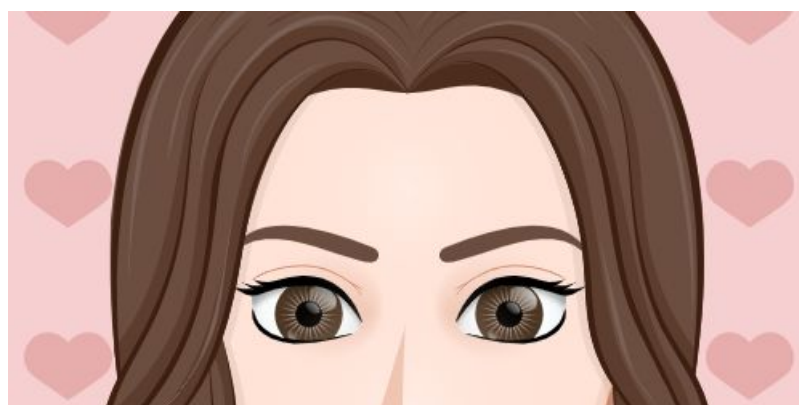
Erasmus + (Padlet) Faisons connaissance !

► Dans le cadre du jeu " ¿Quién es ? ", les professeurs demandent à leurs élèves de se créer un avatar à partir d' un générateur d'avatars gratuits . Ils doivent aussi se décrire et se présenter. Les profils sont envoyés et à partir d'une photo de groupe, on devine qui est qui. Les productions réalisées par les élèves français et espagnols sont déposées sur un Padlet :