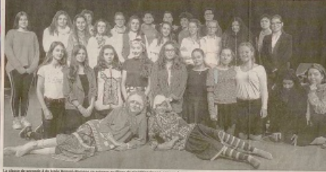
La classe de seconde 4 de l'EPS Bassin-Poitaine se prépare au stage de répétition final-évaluation.

Le projet de l'histoire de Jean Valjean, nous a permis de travailler sur les thèmes de la justice, de la rédemption, de la fraternité. Les élèves ont pu s'exprimer et se faire entendre.