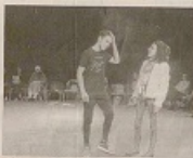
Un échange de regards en regardant pour le coup.

Une expérience enrichissante Les élèves ont pu s'exprimer et se faire entendre. C'est une expérience enrichissante qui nous a permis de découvrir les capacités de nos élèves et de leur faire vivre une véritable aventure.