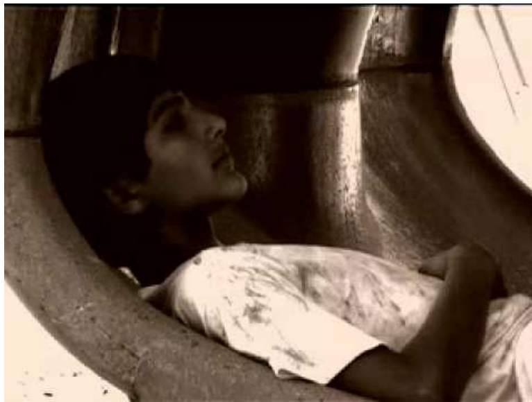
Juanes: La Historia de Juan ( Video Youtube ) Le clip de la chanson de Juanes