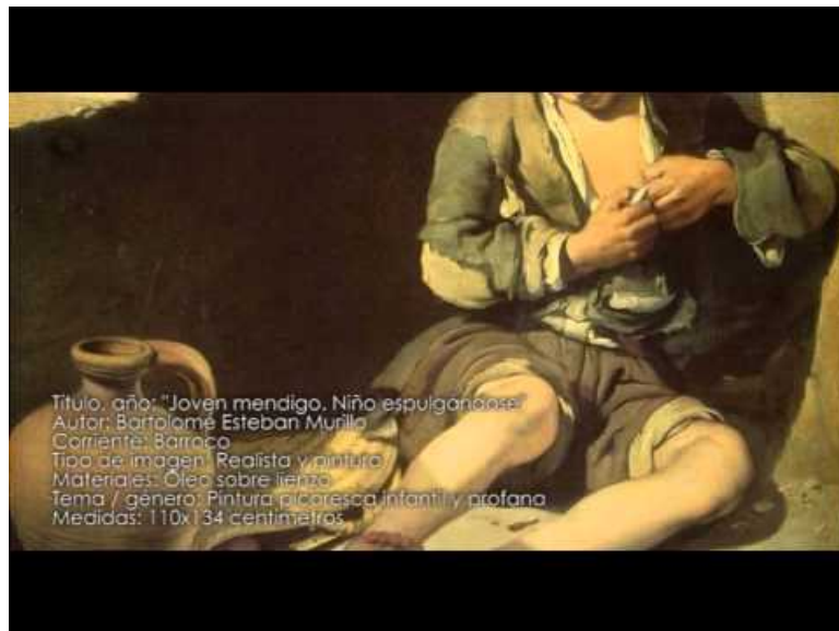
Bartolomé Esteban Murillo ( Video Youtube ) Vidéo complète sur Bartolomé Esteban Murillo.

Il s'agit d'un atelier de compréhension orale à partir d'un extrait d'une vidéo sur le tableau de Murillo " Niño espulgándose " (début 1min 35 - fin 2min 38). Cet atelier est proposé aux élèves se sentant le moins à l'aise car il permet de consolider leurs acquis et de les mettre en confiance tout en prenant appui sur le son et l'image.