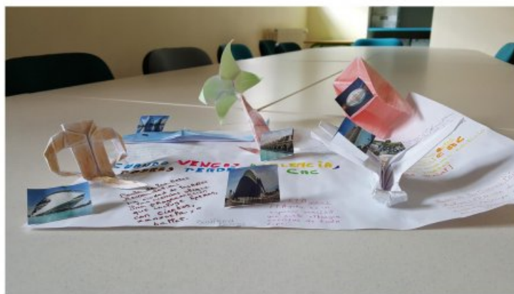
L'affiche d'un élève