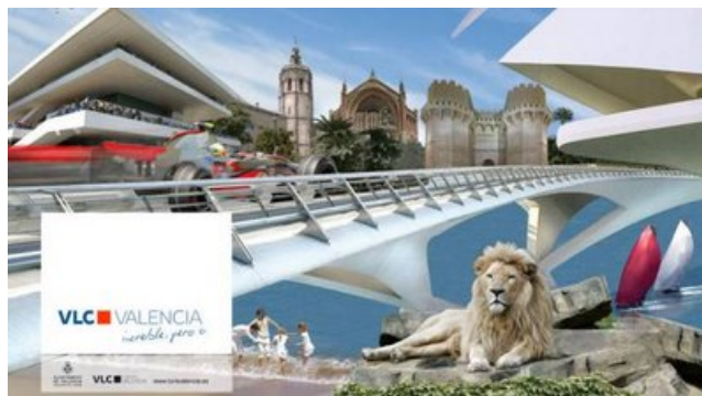
Affiche de VLC sans le texte.