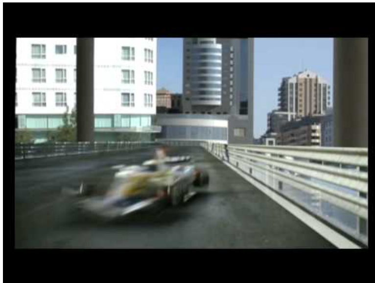
VLC Valencia Increíble pero cierta (Video Youtube) Vidéo touristique sur Valencia.