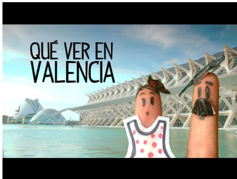
Qué ver en Valencia, turismo España (Video Youtube) Video de Tío Spanish sur Valencia.