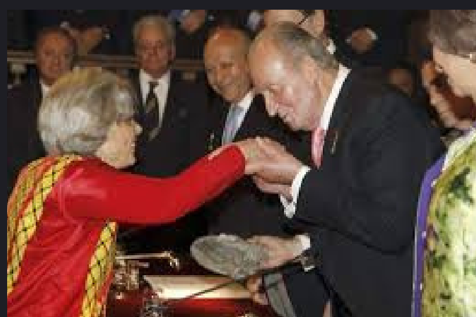
El premio de Cervantès (1988)

María Zambrano es la primera mujer en recibir un premio que ha permitido a otras mujeres expresarse y afirmarse en la sociedad