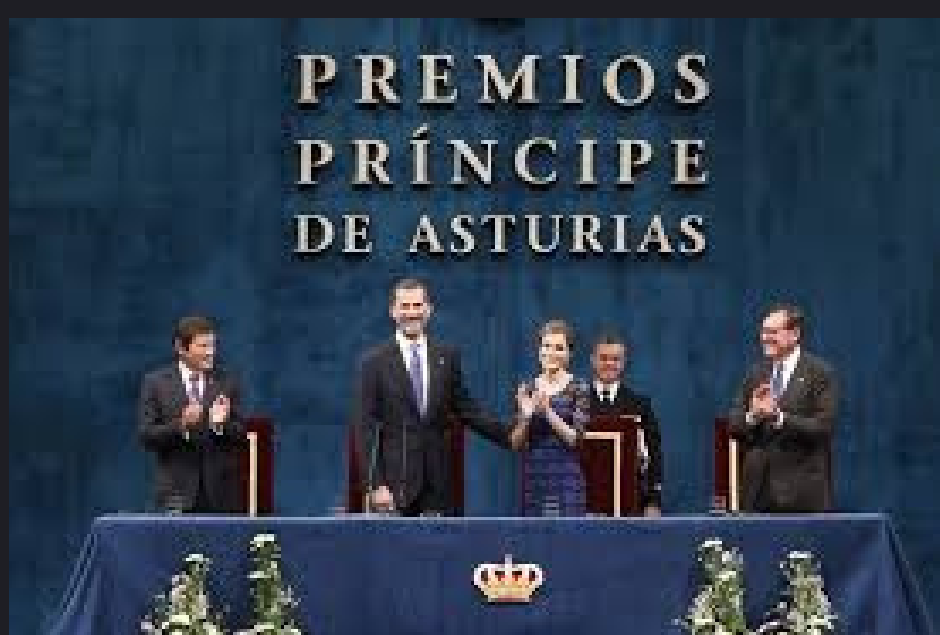
Premio príncipe de Asturias (1981)