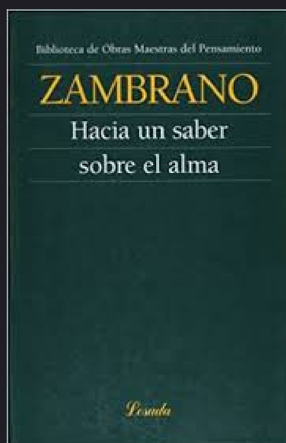
Hacia un saber sobre el alma (1950)