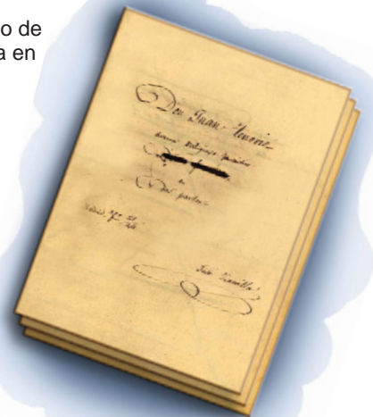
Manuscrito original, 1844

Molière estrenó 'Don Juan o el convidado de piedra' (1665), Goldoni retomó la historia en 'Juan Tenorio o el libertino castigado' (1734) y Mozart compuso la ópera 'Don Giovanni' (1787). Los escritores románticos, como Zorrilla, cambiaron el tratamiento del personaje: Lord Byron compuso el poema 'Don Juan' (1819-1824) y Prosper Mérimée escribió 'Las ánimas del purgatorio'.