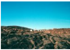
Village du Nord-québécois

Au Québec, le Nord est omniprésent, et il n'est pas " un monde lointain situé à gauche du soleil levant », affirme Louis-Edmond Hamelin , homme de terrain tout autant qu'intellectuel, après 50 années de recherches dans la zone circumpolaire.