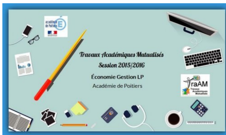
Présentation réalisée avec Genially