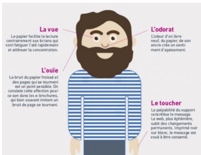
Mailing : quand l'émotion mène à la mémorisation

UN CLIN D'ŒIL AU SUPPORT : savoir jouer avec le papier