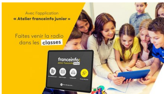
L'appli franceinfo junior en 2 minutes ! (Video Dailymotion)

Il suffit d'une tablette et de l'application "France Info Junior". Un micro pourra être utile afin d'améliorer la qualité du son, mais il n'est pas indispensable. Les émissions créées avec cette application ont une durée maximale de 7 minutes, ce qui est un format idéal pour l'école primaire. L'application est très intuitive et complète. Pas besoin de passer par un ordinateur pour faire ensuite du montage audio.