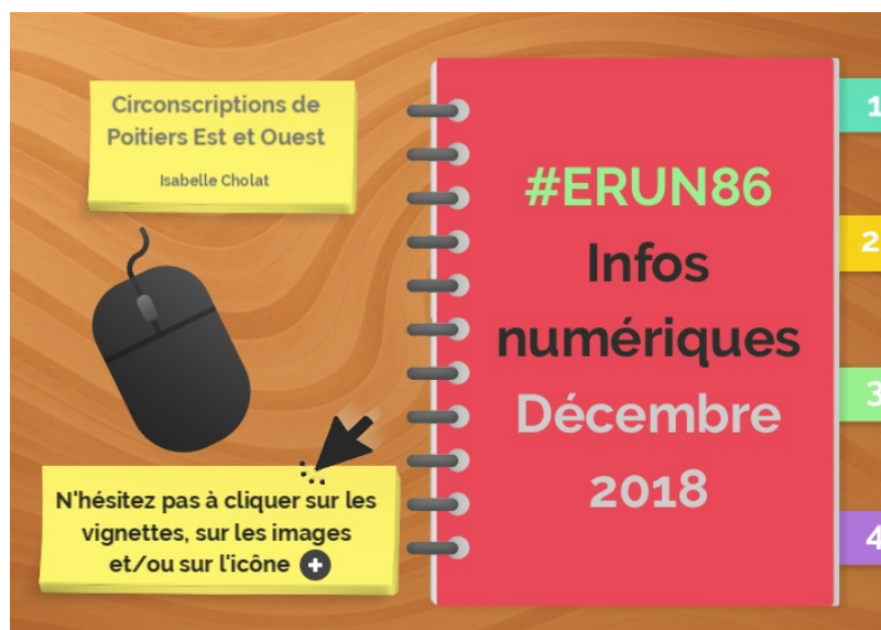
ERUN86-dec18 by CHOLAT on Genial.ly (Genially) ERUN86-dec18 by CHOLAT on Genial.ly

Les circonscriptions de Poitiers Est et Ouest vous proposent leur bulletin d'informations numériques de décembre 2018.