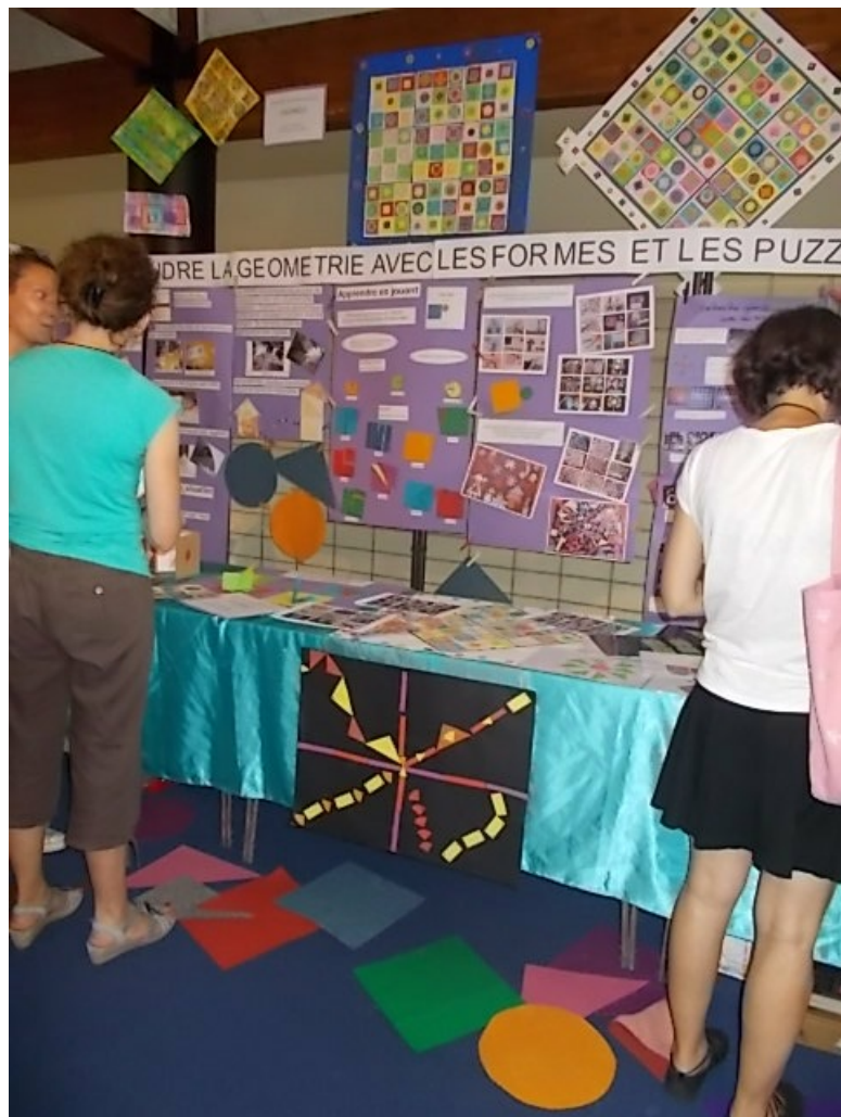
L'exposition académique Poitou-Charentes sur les PUZZLES

Nous avons participé à des conférences plénières et des communications (lieux de formation, de partage et d'émotions)