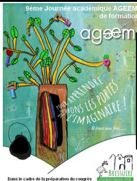
Dans le cadre de la préparation du congrès

Un courrier sera prochainement adressé aux écoles pour préciser ces premières informations.