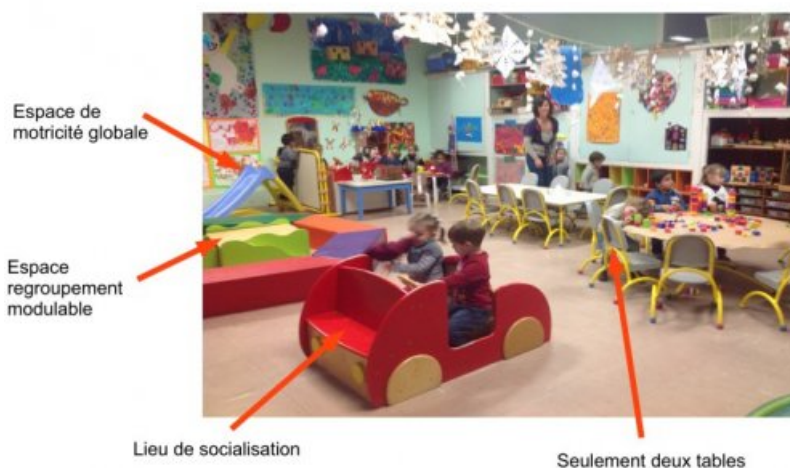
Un exemple d'aménagement de classe

J'interroge l'organisation spatiale de ma classe (PDF de 6.8 ko)